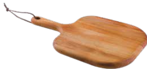
Tábua Burguer Burger Serving Board | Tabla para Hamburguesa Madeira Mogno Africano African Mahogany Wood | Madera Tipo Caoba Africana 13348/641 340x230x15 mm | 13,3x9x0,5 inches