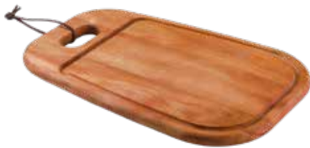
Tábua Steak Steak Serving Board | Tabla para Steak Madeira Mogno Africano African Mahogany Wood | Madera Tipo Caoba Africana 13347/641 340x230x15 mm | 13,3x9x0,5 inches