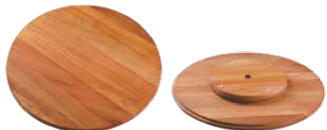
Lazy Susan Madeira Mogno Africano African Mahogany Wood | Madera Tipo Caoba Africana 13355/641 ø350x33 mm | ø13,7x1,3 inches