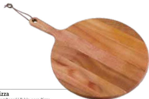
Tábua Pizza Pizza Serving Board | Tabla para Pizza Madeira Mogno Africano African Mahogany Wood | Madera Tipo Caoba Africana 13354/641 420x300x15 mm | 16,5x7,8x0,5 inches