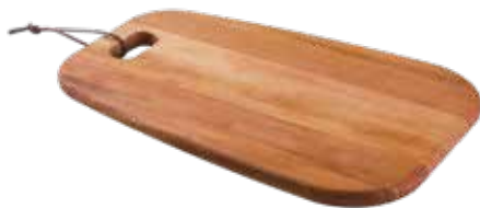
Tábua Burguer Burger Serving Board | Tabla para Hamburguesa Madeira Mogno Africano African Mahogany Wood | Madera Tipo Caoba Africana 13346/641 340x230x15 mm | 13,3x9x0,5 inches