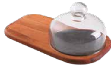
Tábua Cheese com Pedra e Tampa de Vidro Cheese Serving Board with Stone and Glass Cover Tabla para Queso con Piedra y Tapa de Vidrio Madeira Mogno Africano African Mahogany Wood | Madera Tipo Caoba Africana 10239/673 318x190x18 mm | 12,5x7,4x0,7 inches