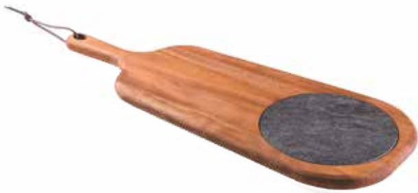
Tábua Cheese com Pedra Cheese Serving Board with Stone Tabla para Queso con Piedra Madeira Mogno Africano African Mahogany Wood | Madera Tipo Caoba Africana 10239/671 480x190x18 mm | 18,8x7,4x0,7 inches