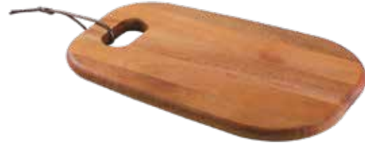
Tábua Antipasti Antipasti Serving Board | Tabla para Antipasti Madeira Mogno Africano African Mahogany Wood | Madera Tipo Caoba Africana 13345/641 300x200x15 mm | 11,8x7,8x0,5 inches