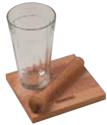
Kit Caipirinha Plus - 3 pç. Plus Caipirinha Kit - 3 pc. | Kit Caipirinha Plus - 3 pz. Madeira Tipo Caobá Africana African Mahogany Wood | Madera Tipo Caoba Africana 10239/681 | 130x145x15 mm | 5,7x5,1x0,6 inches