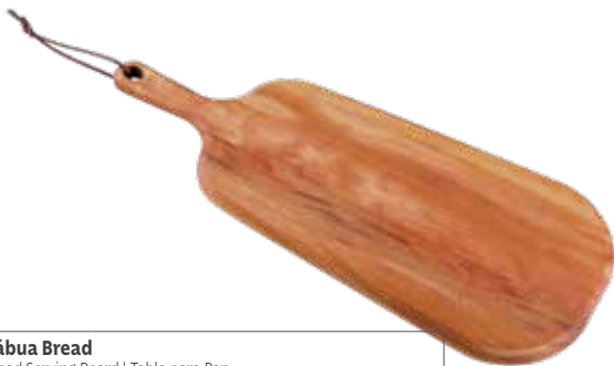
Tábua Bread Bread Serving Board | Tabla para Pan Madeira Mogno Africano African Mahogany Wood | Madera Tipo Caoba Africana 13352/641 480x190x18 mm | 18,8x7,4x0,7 inches