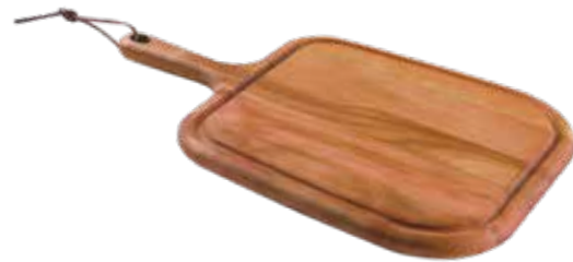
Tábua Steak Steak Serving Board | Tabla para Steak Madeira Mogno Africano African Mahogany Wood | Madera Tipo Caoba Africana 13351/641 400x270x18 mm | 15,7x10,6x0,7 inches