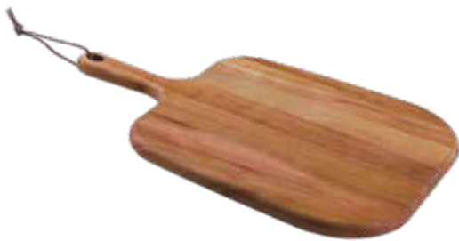
Tábua Cheese Cheese Serving Board | Tabla para Queso Madeira Mogno Africano African Mahogany Wood | Madera Tipo Caoba Africana 13350/641 400x270x18 mm | 15,7x10,6x0,7 inches