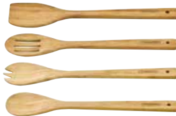
Conjunto Bamboo - 4 pz. Bamboo Set - 4 pc | Conjunto Bamboo - 4 pz. 10239/386 350x65x10 mm | 13,8x2,6x0,4 inches