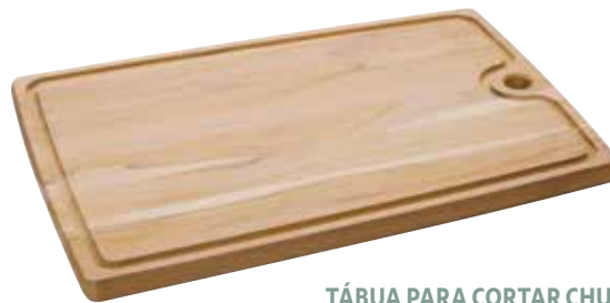
TÁBUA PARA CORTAR CHURRASCO

CUTTING BOARD BARBECUE TABLA PARA CORTAR ASADO