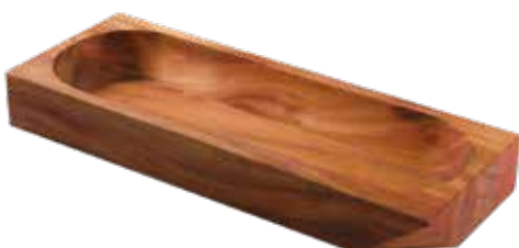
Snack Bowl Madeira Mogno Africano African Mahogany Wood | Madera Tipo Caoba Africana 13356/641 350x150x50 mm | 13,7x5,9x1,9 inches