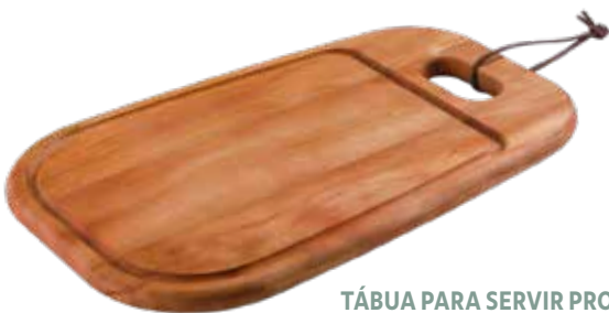
TÁBUA PARA SERVIR PROVENCE

Produtos para fazer bonito na casa e nos espaços públicos, como bares, hotéis e restaurantes.