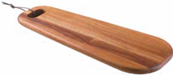
Tábua Antipasti Antipasti Serving Board | Tabla para Antipasti Madeira Mogno Africano African Mahogany Wood | Madera Tipo Caoba Africana 13353/641 480x190x18 mm | 18,8x7,8x0,7 inches