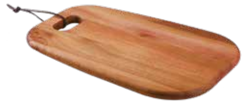
Tábua Cheese Cheese Serving Board | Tabla para Queso Madeira Mogno Africano African Mahogany Wood | Madera Tipo Caoba Africana 13349/641 400x270x18 mm | 15,7x10,6x0,7 inches