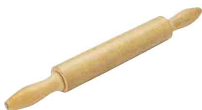
Rolo de Massa Móvel Rotatory Pastry Roller | Palote de Masa Móvil

Madeira Clara | Light-Colored Wood | Madera Clara