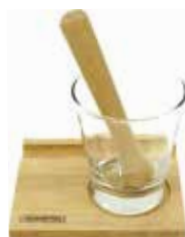
Kit Caipirinha - 3 pç. Caipirinha Set - 3 pc. | Kit Caipirinã - 3 pz.

10016/032 | ø51x445 mm | ø2,0x17,5 inches