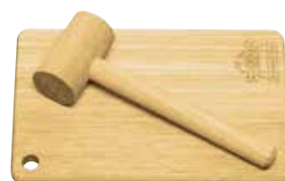
Conjunto Toc Toc - 2 pç. Board and Hammer Set - 2 pc. | Conjunto Tabla y Martillo - 2 pz.

10239/211 | 145x130x12 mm | 5,7x5,11x0,47 inches